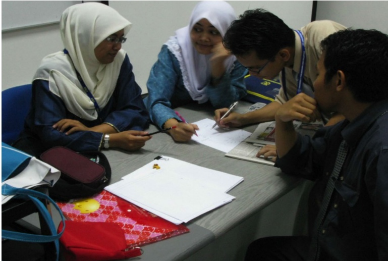
Rajah 3: Kaedah Kerja Lapangan