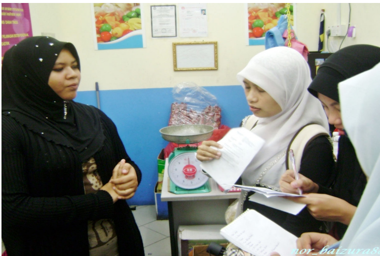
Rajah 2: Kaedah Penyelidikan