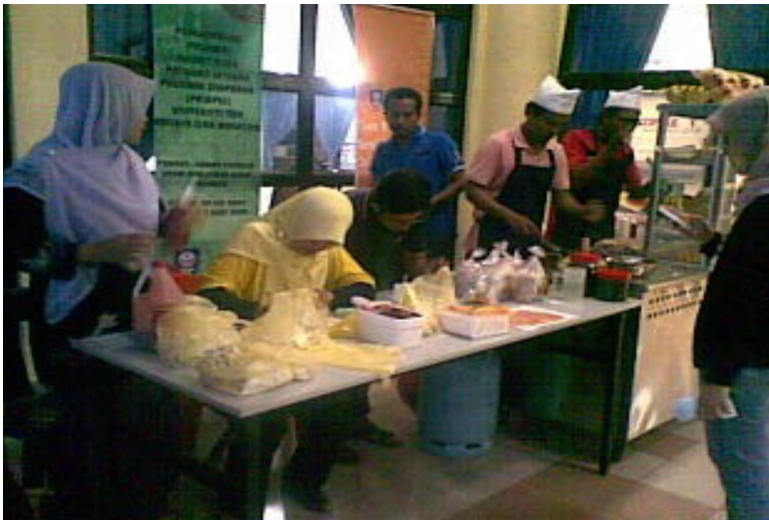
Rajah 4: Kaedah Projek Perniagaan