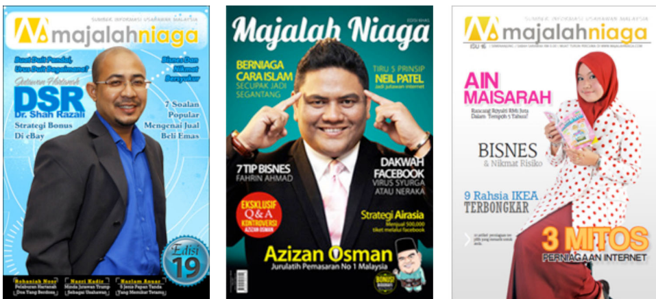
Rajah 5: Tokoh Usahawan Malaysia

Toh (2004), pula menyatakan keusahawanan melibatkan individu yang berkebolehan menggunakan peluang untuk perniagaan dan membentuk organisasi untuk pembangunan dan pengurusan perniagaan yang berjaya.