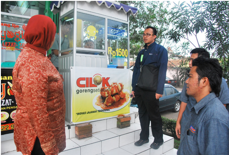
Rajah 1: Kaedah Kerja Lapangan